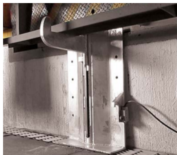
EJEMPLO: Restrictor enganchado

Acción manual con gancho de acero galvanizado y pintado en color gris oscuro, cuenta con una placa de montaje de acero de 1/2" con resistencia 55,000 LBS. Rango de trabajo 12" a 30" del suelo.